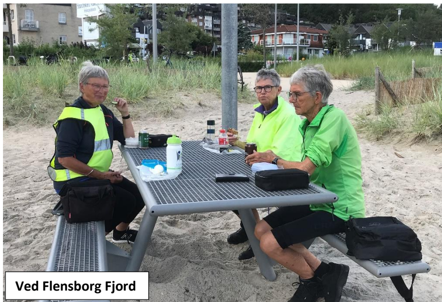
Ved Flensborg Fjord