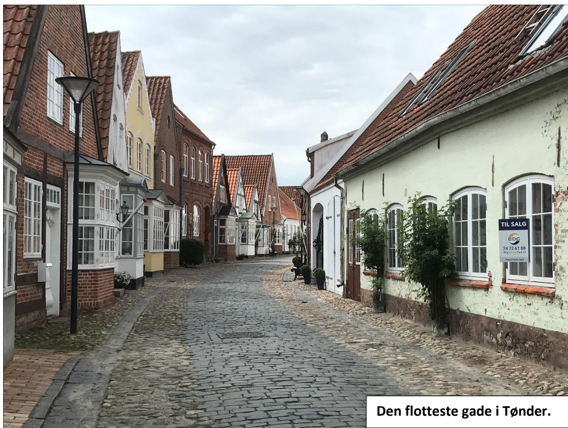
Den flotteste gade i Tønder.