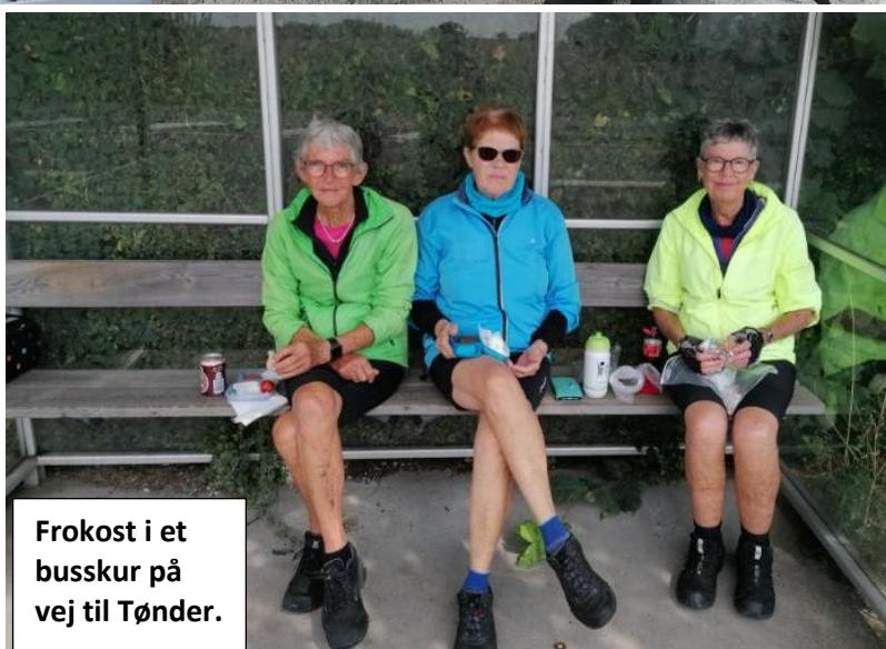
Frokost i et buskur på vej til Tønder.