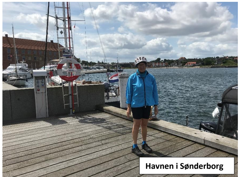
Havnen i Sønderborg