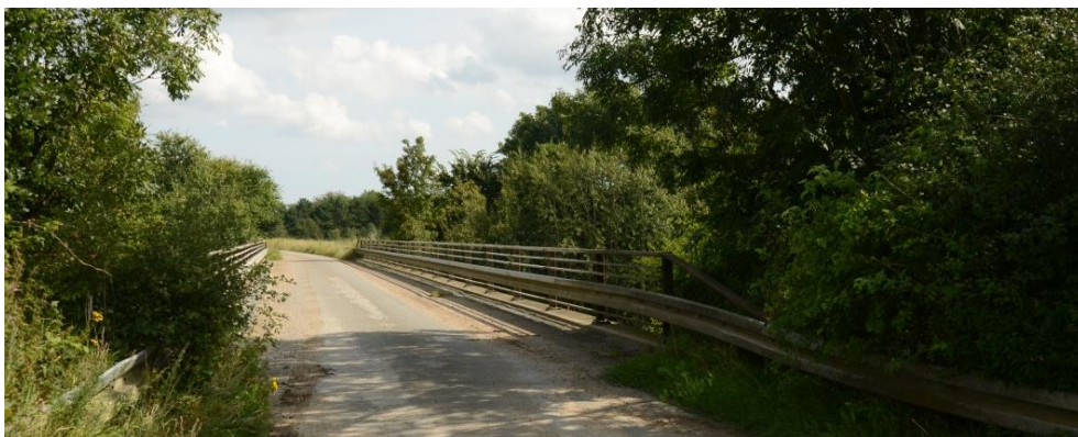
Bramdrup Vestergade. Broen over motorvejen. 6.9.24

For cyklisterne vil det være en omvej, men sikkerhedsmæssigt nok en fordel. Et enkelt spørgsmål: Hvorfor vente til 2027 med at etablere stien? Den bør jo være klar før ombygning af motorvejskrydset.