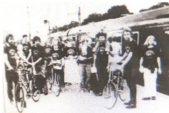
Cyklist demonstration 1980. Dagbladet

Dansk Cyklist Forbund demonstrerede imod DSB's forbud mod at tage cykler med i S – togene, ved at 12 af forbundets medlemmer tog deres cykler med S – toget. Cyklistforbundet oplyste efter demonstrationen, at ingen blev forulempet, da cykelkæderne var tørret af inden aktionen.