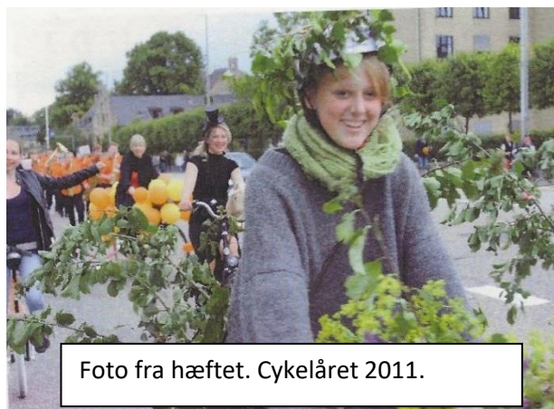
Foto fra hæftet. Cykelåret 2011.

Rock Ur Bike arrangeres af Roskilde Kommune, Musicon og Roskilde Festival.