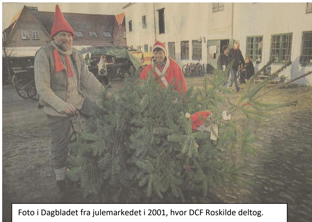
Foto i Dagbladet fra julemarkedet i 2001, hvor DCF Roskilde deltog.

18. december 1999. Økologisk Julemarked.