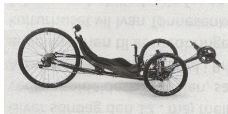
Liggecykel, ikke fra disse mesterskaber.

Vi tager til Farum for at se på europamesterskaberne i HPV (Human Powered Vehicles). Der kommer over 100 sjove liggecykler fra mange lande.