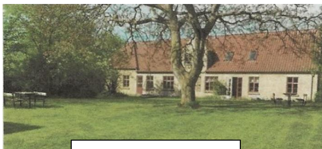
Pillemark Gl. Skole

Vi hentede vores bagage og cyklede til færgen, og det havde været en dejlig tur med søde cyklister og en masse dejlige oplevelser.