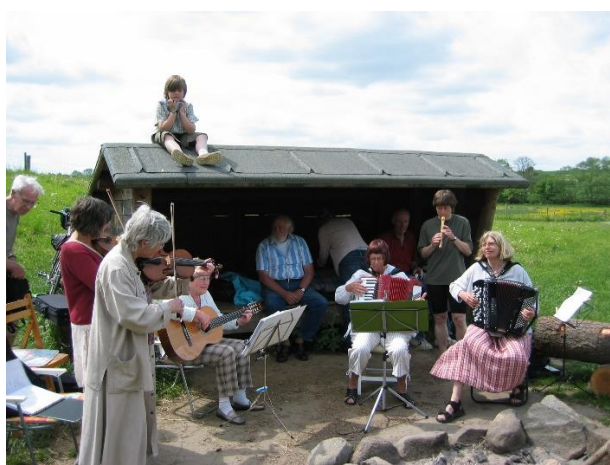
Der blev spillet og sunget på jubilæumsturen

Vi vil besøge møllen og området omkring møllen (møllegård, kålgård, lægeurtehave, information og møllecafé samt trampestier). Jubilæet fejrer vi desuden med lidt godt til ganen i naturen.