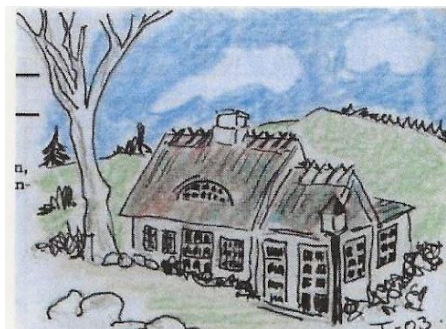
Mosehuset ved Dyndet