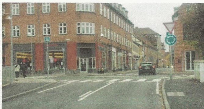
Rundkørslen Dronning Margrethes Vej/ Frederiksborgvej.

risiko for højresvingulykker mellem biler og cykler, og som også er til gene for cyklisterne at køre hen over. Kommunen er nu villig til at fjerne kantstenene/brostenene.