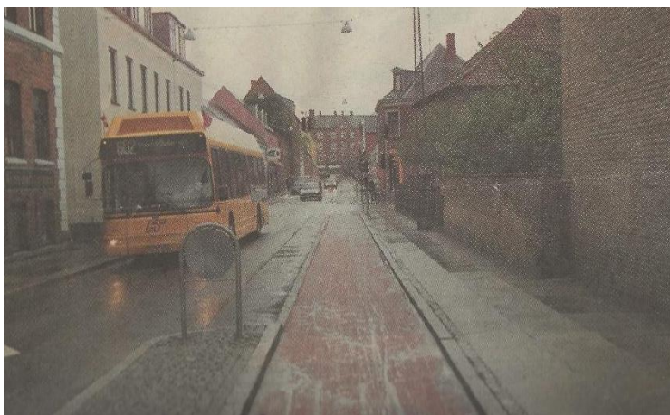
Hersegade.

Overfor Hersegade – i Jernbanegade er der lavet en lille ”lomme” til de cyklister, der skal svinge til venstre ad Hersegade. Lommen er forsynet med en spole, der registrer cyklisterne og aktiverer cyklistsignalet.